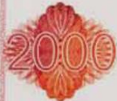
Billete con la efigie de Juan Ramón Jiménez y el Ayuntamiento de Moguer