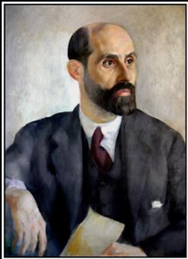
Juan Ramón Jiménez